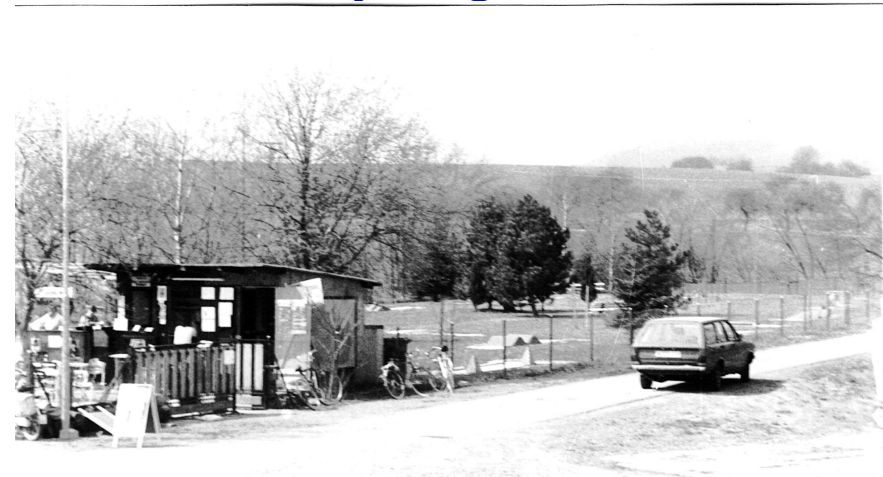
Historisches Foto unserer Minigolfanlage ca. 1982

(Navi bitte mit Hüttenstr. 45, 35638 Leun nutzen, dann landen Sie am Ortsausgang und müssen nur noch in der folgenden Rechtskurve links abbiegen!)