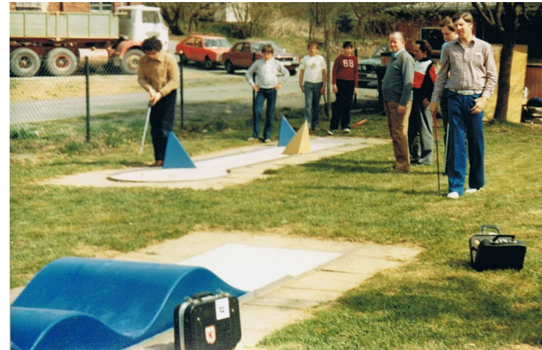
Minigolfanlage Biskirchen 1984